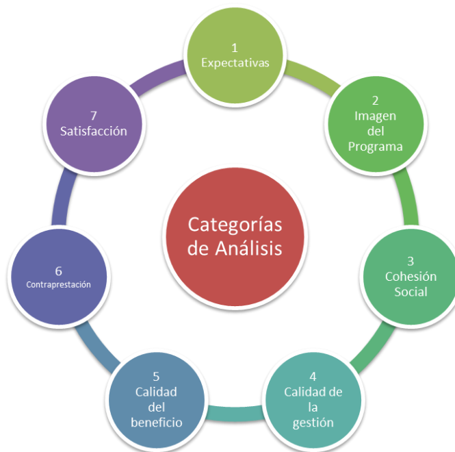
Imagen 1. Categorías de análisis.